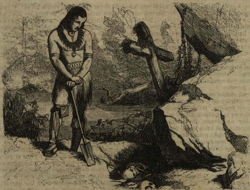
CHACTAS VUELVE Á HALLAR LA SEPULTURA DE ATALA.

profunda para que me negase á obedecerle. Al dia siguiente me separé de mi respetable huésped, que estrechándome sobre su corazon, me dió sus últimos consejos, su última bendicion y sus últimas lágrimas. Pasé á la sepultura, y me sorprendí al hallar en ella una cruz que se alzaba sobre la muerte, como se ve descollar sobre las olas el mástil de un bajel despues de un naufragio. Conocí que el solitario habia ido á orar á la tumba, durante la noche: señal de amistad y de religion que escitó en mí la mas tierna gratitud, y sentí la tentacion de abrir la fosa y contemplar otra vez á mi amada; pero me retuvo cierto religioso temor, y me contenté con sentarme sobre la recien removida tierra. Apoyando un codo en mis rodillas, y la cabeza en mi mano, quedé abismado en la mas amarga abstraccion. ¡Oh René! Allí me entregué por primera vez á serias reflexiones acerca de la vanidad