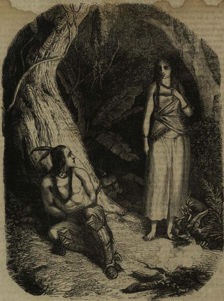
ATALA LIBRANDO Á CHACTAS.

teza aumentaba á medida que adelantábamos. Muchas veces se estremecía sin motivo alguno, y volvía presurosa la cabeza, ó bien la sorprendía fijando en mí una mirada de amor, que luego dirigía al cielo con profunda melancolía. Lo que especialmente me alarmaba era un secreto, un pensamiento oculto en