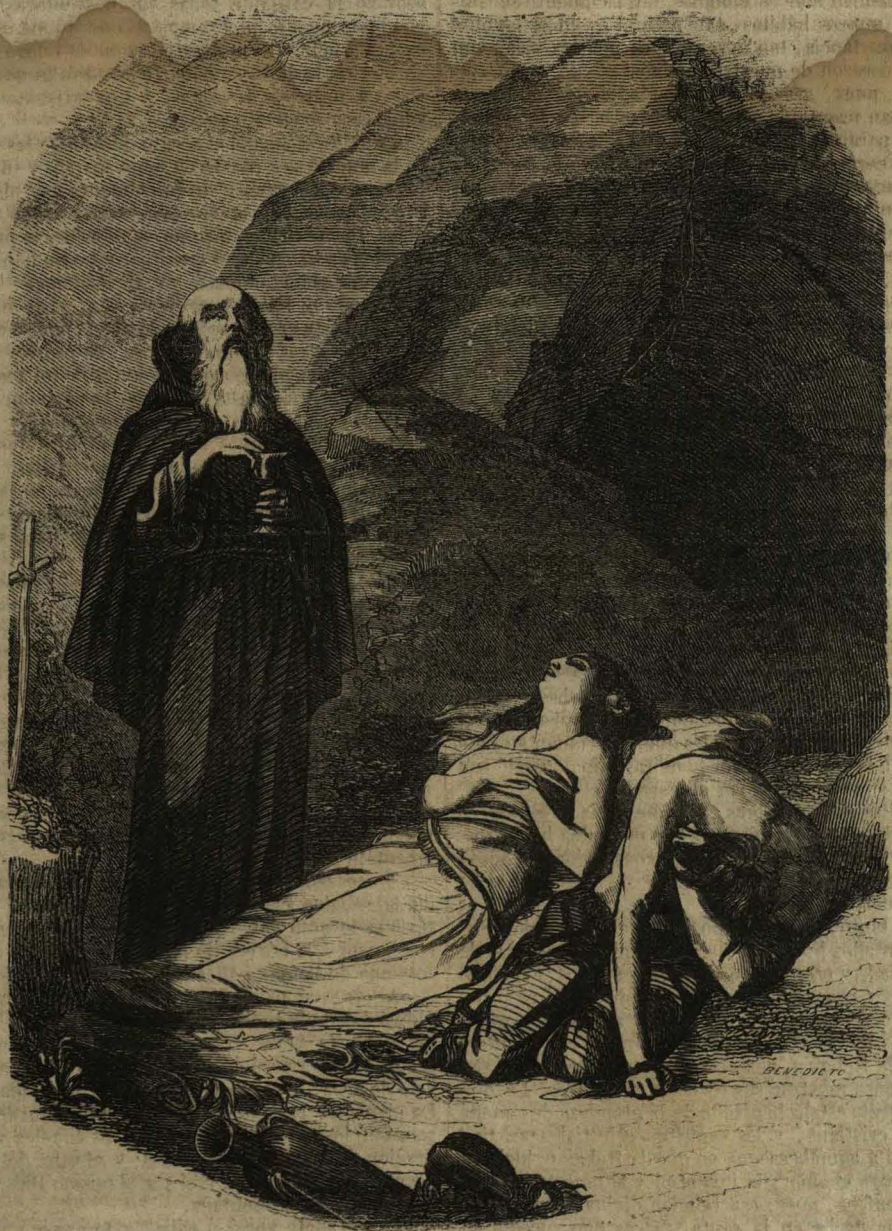
ULTIMOS MOMENTOS DE ATALA.

»siempre mi cabeza ha sido calva, ni mi pecho ha »palpitado tan tranquilo cual hoy te parece. Fia en »mi esperiencia. Si constante en sus afectos, pu- »diese el hombre alimentar incesantemente un sen- »timiento incesantemente renovado, es indudable »que la soledad y el amor le igualarian al mismo Dios, »porque estos son los dos eternos placeres del Ser